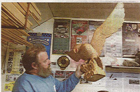
Orel, ki ga je izklesal, kot edini Vinkovih lesenih ptic ne leti.