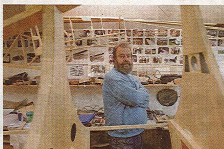
Steno v ozadju si je uredil kot fotogalerijo svojih dosežkov.