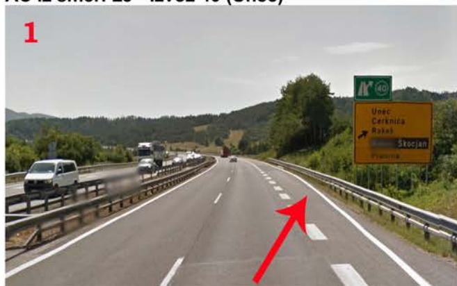
AC iz smeri LJ - Izvoz 40 (Unec)