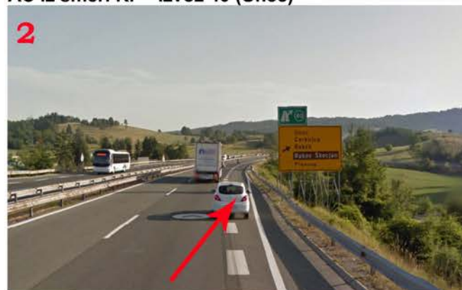
AC iz smeri KP - Izvoz 40 (Unec)