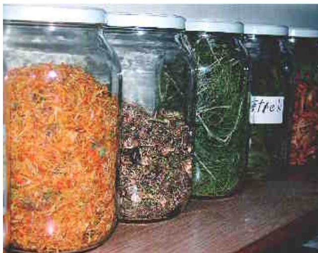
Od ognjiča do vrtničnih cvetov, dobre misli in drugih za zdravje blagodejnih zeli

»Ja, hudo je bilo,« je časovni stroj zavrtela za sedem let nazaj. »Tako hudo, da je ves gnev priplaval na površje, začela pa sem ga zlivati na vsakega, ki je prišel mimo. Pa četudi mi ni storil nič hudega. Zadostovalo je že, da se je ob napačnem času znašel na napačnem kraju, torej v moji bližini. In tako sem se naposled po številnih izbruhih bolečine znašla v norišnici, doma pa so