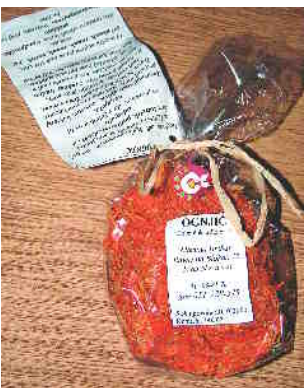
Ognjič preprečuje, da bi nam nagajal želodec, je dober za kri in pravi zmagovalec pri oskrbi ran, oteklin in podplutb.

»Na vzpenjačih se in večkrat strmo padajoči poti sem dojela, da je treba spore reševati z zvrhano žlico trdne volje in vse skupaj začiniti s humorjem. A najpomembneje je, da človek nenehno raste in se spreminja ter nikoli ne pričakuje, da se bodo drugi spremenili namesto njega. In da se bori zase, saj se nihče drug ne bo. Ven-