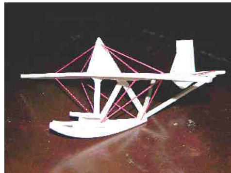
»Veste, da so Bloke pred leti slovele po jadralnem letalstvu? Zato smo lani pripravili snidenje letalskih veteranov.«

dežno moč, in ko sem bila že trdno odločena, da sem na pravi poti, me je vnovič pokosila bridka izkušnja. Za nakup zelišč sem si namreč sposodila denar in obetala sem si najmanj toliko zaslužka, da bom poplačala dolg. Pa sem nasankala. Kupčijo sem namreč sklenila z zlikovcem, ki je podlo izkoristil moje zaupanje. Ker nisva podpisala pogodbe, ampak sva se zgolj ustno domenila, kako bova poslovala, je gladko izrabil mojo nepazljivost. Tako sem se spet znašla na robu obupa.«